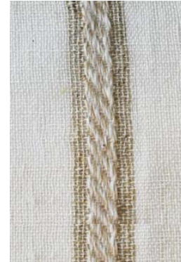
Missi - Natural