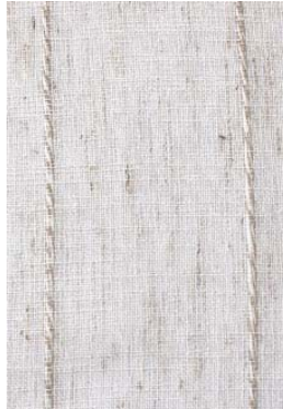
✓ Yana - Natural