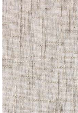
✓ Nilo - Natural