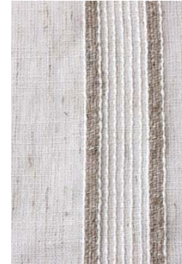
Delta - Natural