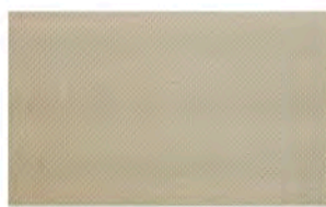
4 BEIGE CLARO